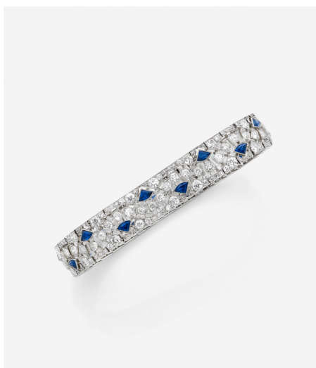
VAN CLEEF & ARPELS Bracelet ruban Art Déco en platine, orné de saphirs et diamants, circa 1925 Estimation : 25 000 - 30 000 €