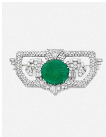
MAUBOUSSIN Importante broche Art Déco en platine, or, émeraude gravée et diamants, circa 1930 Estimation : 20 000 - 30 000 €