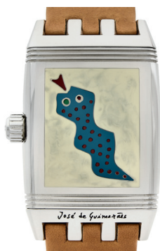
Jaeger-LECOULTRE Reverso Arte Portuguesa Édition limitée à 40 exemplaires Estimation : 4 000 - 6 000 €