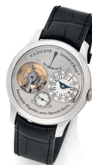
FP JOURNE Tourbillon Souverain - 2007 Montre bracelet en platine à remontoir d'égalité avec seconde morte, tourbillon et réserve de marche. Estimation : 150 000 - 200 000 €