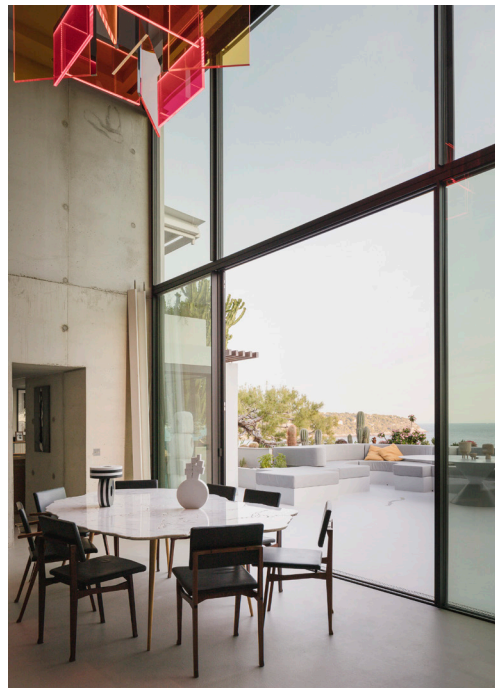
Intérieurs de la maison de notre collectionneuse sur la baie de Roquebrune Cap Martin