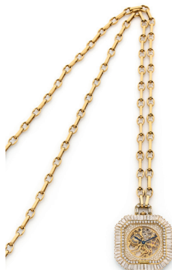
CARTIER Montre pendentif en or jaune et diamants Estimation : 8 000 - 12 000 €